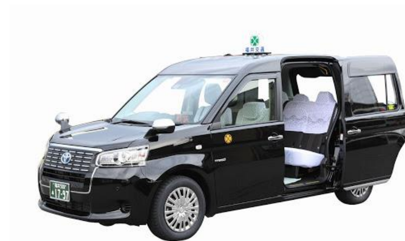
(ジャパントクシー)

通常のセダン型タクシーでなく、高齢者が乗りやすく、車椅子にも対応したユニバーサルデザイン車両(ジャパントクシー)の導入を検討