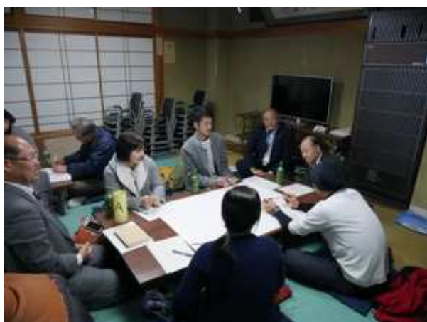
3つの班による住民ワークショップ(A班)