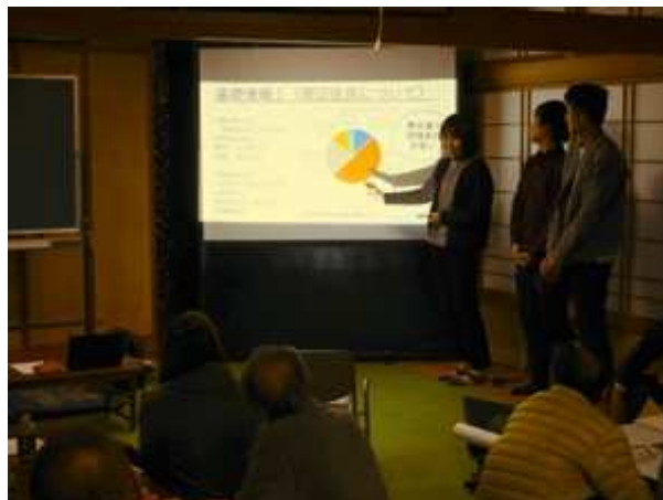
大学生による事例紹介